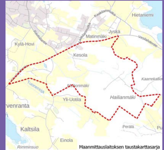
Vesilahdentien eteläisen osayleiskaava-alueen rajausta osoitettuna punaisella pisteiviivalla Maanmittauslaitoksen taustakartalla.

Kaava on tullut vireille 5.7.2023 ja osallistumis- ja arviointisuunnitelma oli nähtävillä 6.-30.7.2023. Yksityisessä omistuksessa oleva suunnitteluala, n. 13 ha, sijaitsee Hinsalassa Pyhäjärven Laukonselän rannalla. Tavoitteena on osoittaa alueelle leirintäalue ja sen tarvitsema lisärakennusoikeus sekä ohjata alueen rakentamista ja muuta maankäyttöä ympäristö ja maisema huomioiden.