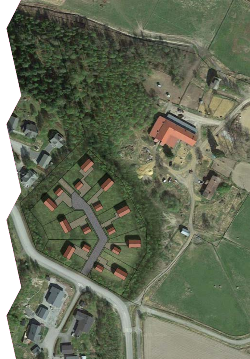
Havainnekuva Hovinkulman asemakaavan muutoksesta. Kaavaehdotus 16.2.2022.

Kunnanhallitus on kokouksessaan 30.10.2023 §:ssä 168 päättänyt käynnistää hankkeen, jossa tavoitteena on laatia asemakaava ja asemakaavan muutos, joka mahdollistaa LT-alueen (Yleisen tien alueen) muodostumisen Vesilahdentielle siten, että tien varteen voidaan mahduttaa kevyenliikenteenväylä, tiesuunnitelman mukaisesti. Kunnanhallitus päätti samalla asettaa osallistumis- ja arviointisuunnitelman nähtäville.