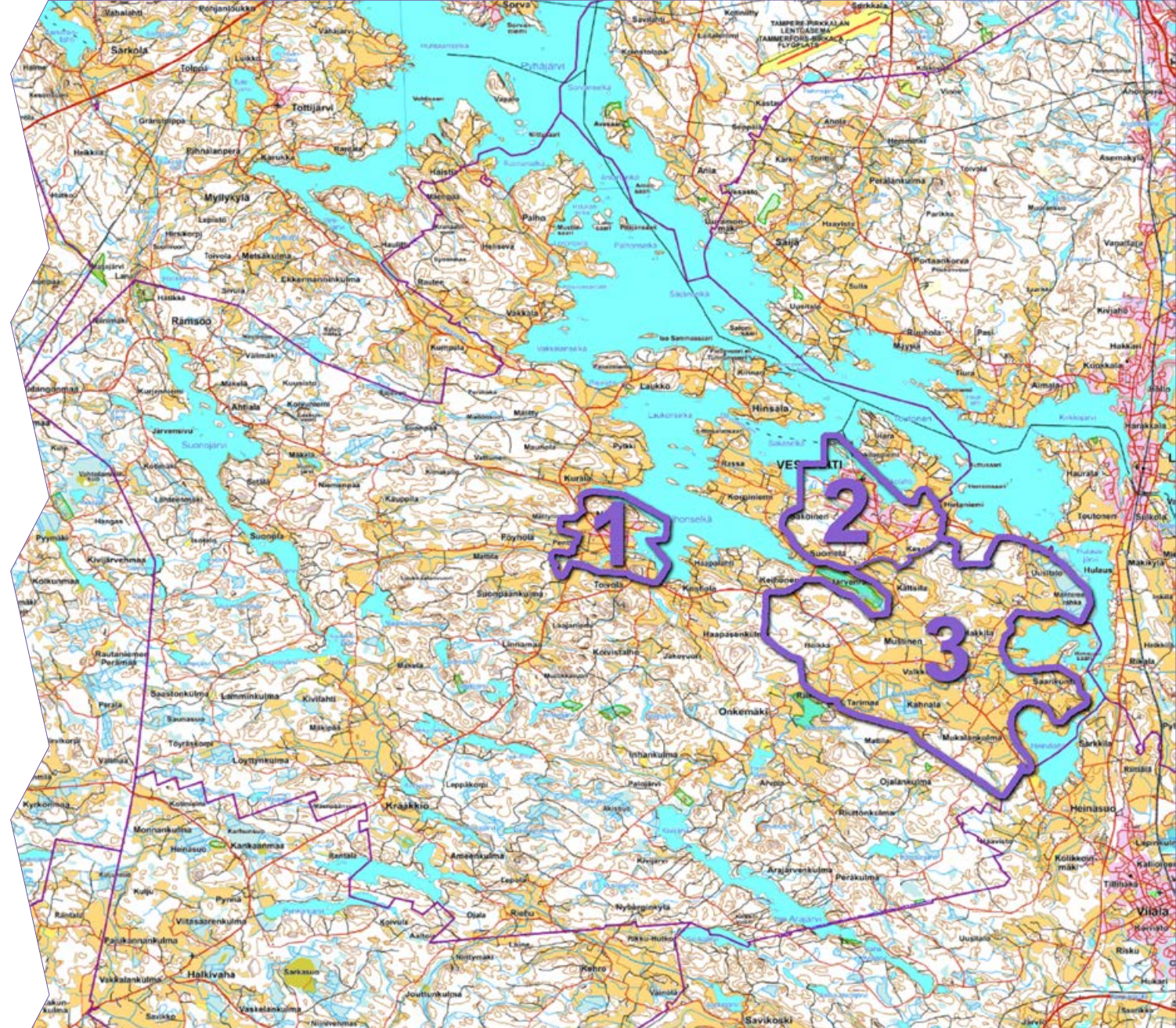
Vesilahden kunnan yleiskaavoitetut alueet

Vesilahden rantaosayleiskaava käsittää kunnan ranta-alueet lukuun ottamatta Kirkonkylän ja Narvan osayleiskaava-alueita sekä jokien ja purojen rantoja. Rantaosayleiskaavan perusteella voidaan myöntää rakennuslupa rakentamista varten. Rakennusmääräykset rantaosayleiskaavan mukaiseen rakentamiseen ovat Vesilahden kunnan rakennusjärjestyksessä.