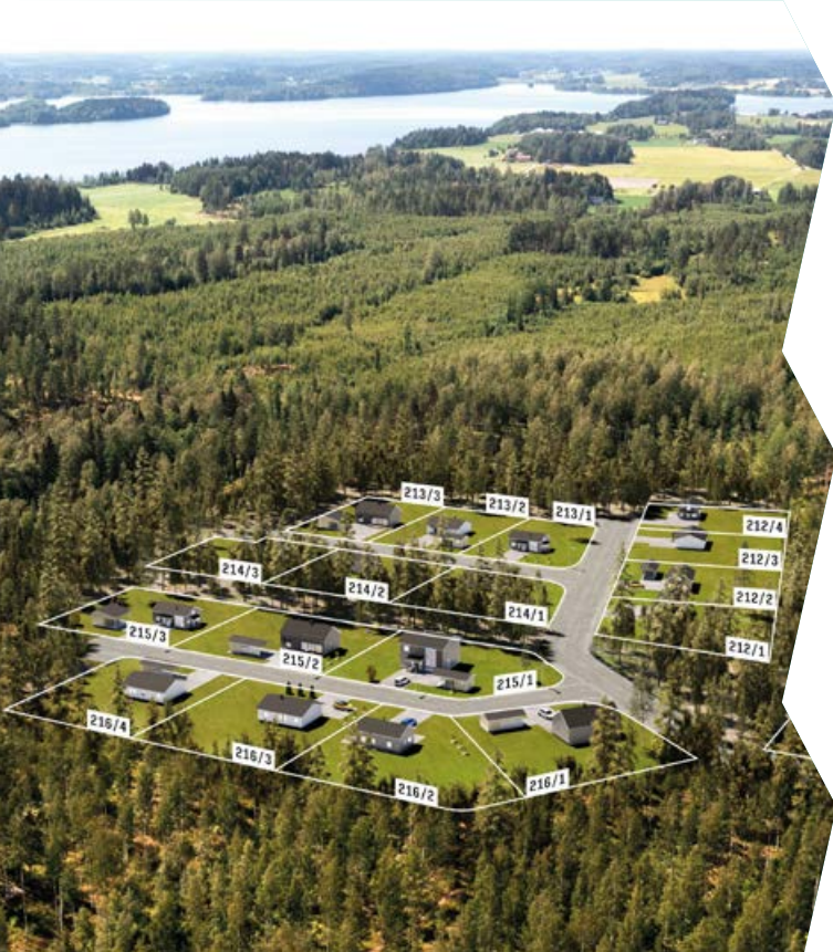
Ote Ämmänhaudanmäen alueen havainnekuvasta.